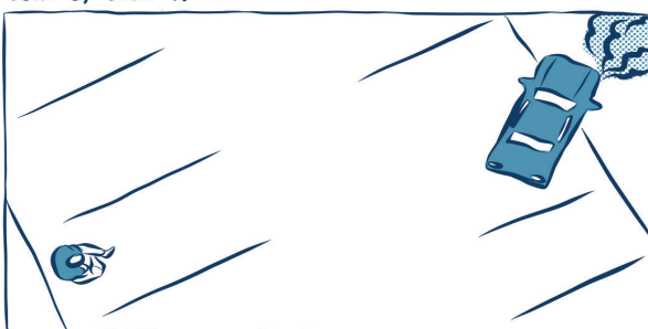
PARKERINGS PLATS, FLYGBILD, VB.

I bildmanuskriptet antecknar du till exempel bildutsnittet, kamerarörelserna, handlingens riktning, ljussättningen, ljudet eller den eventuella dialogen – allt som är till hjälp när scenen filmas.