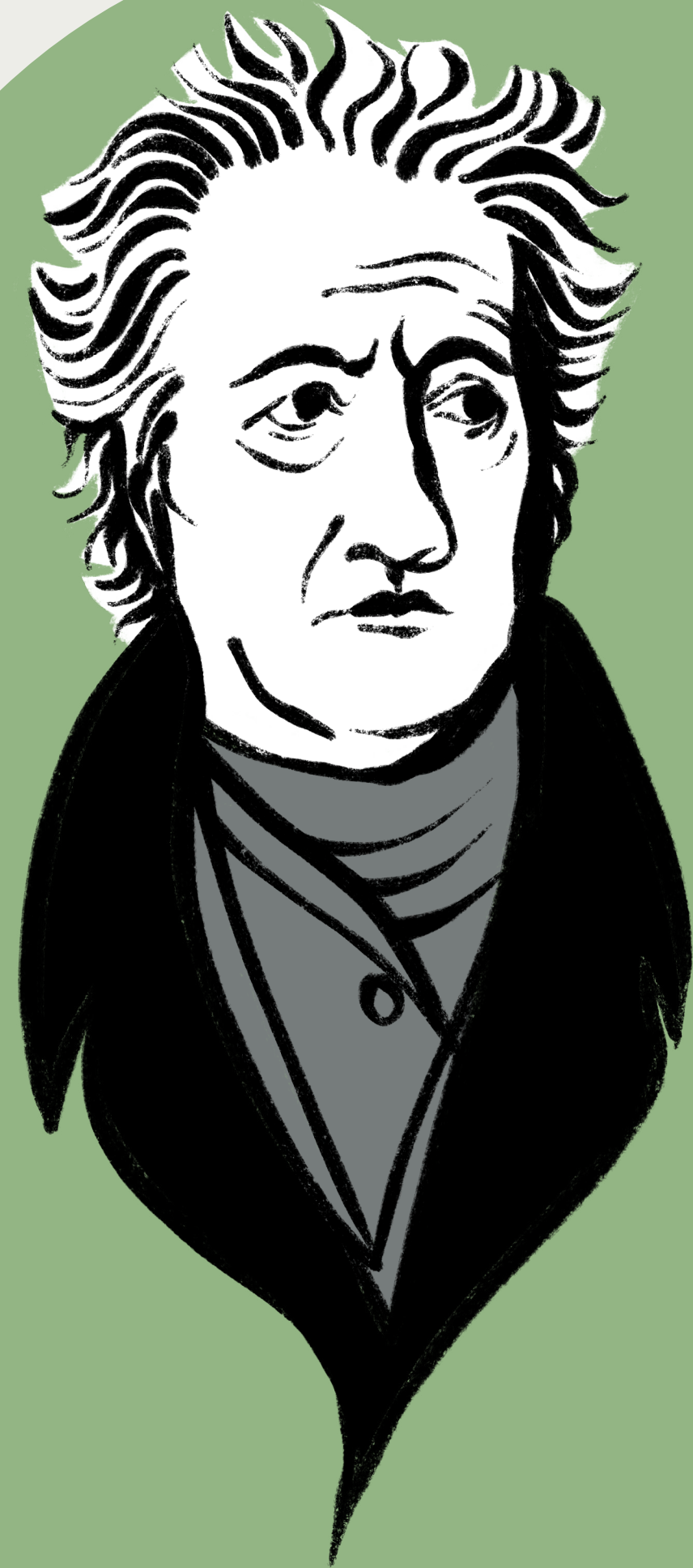
Johann Wolfgang von Goethe 1749-1832

Johann Wolfgang von Goethe ansåg att färger uppstår i gränslandet mellan ljus och mörker.