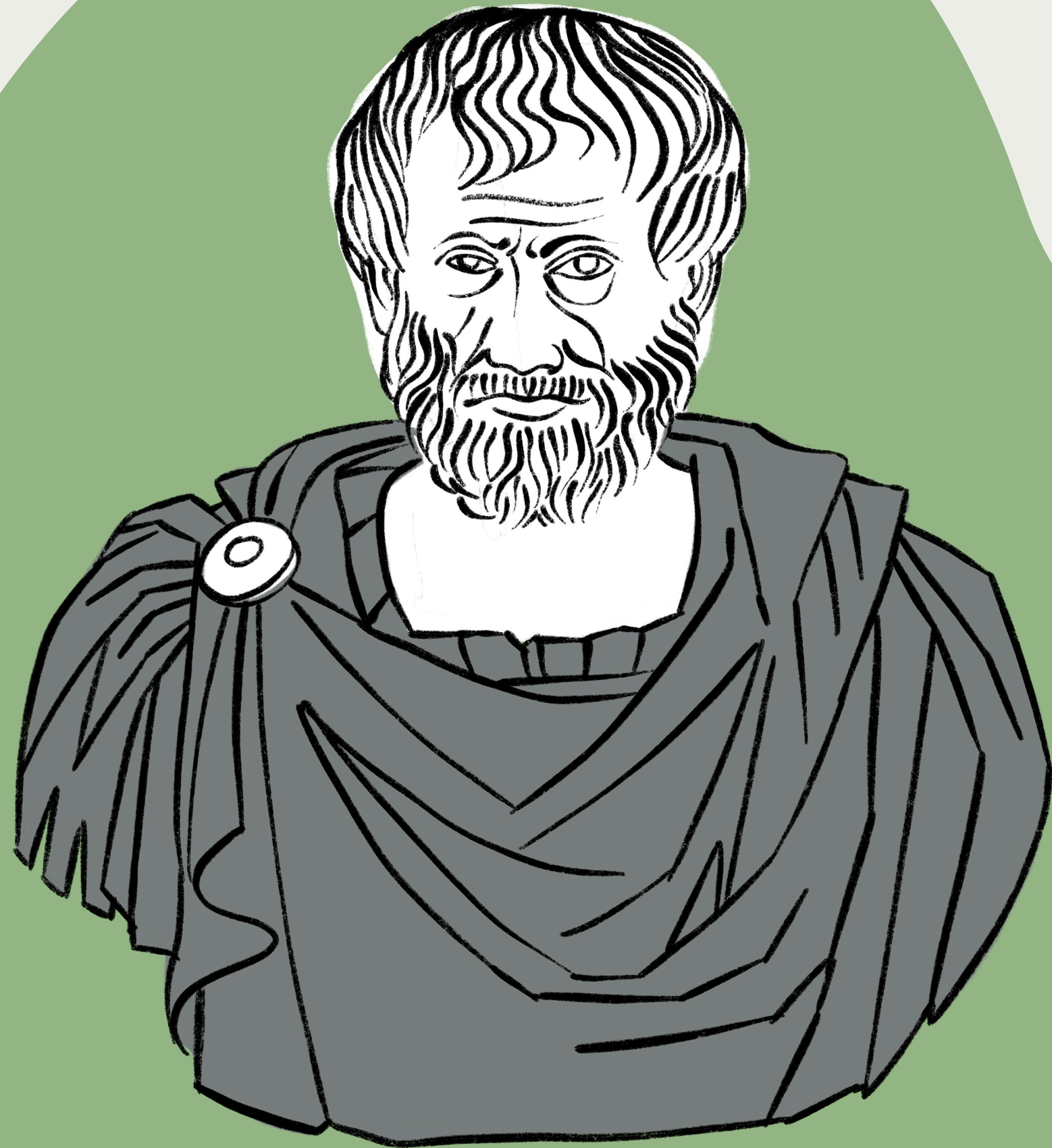
Aristoteles 384-322 f.v.t.

Den grekiske filosofen Aristoteles undersökte färg med hjälp av färgade glasbitar.