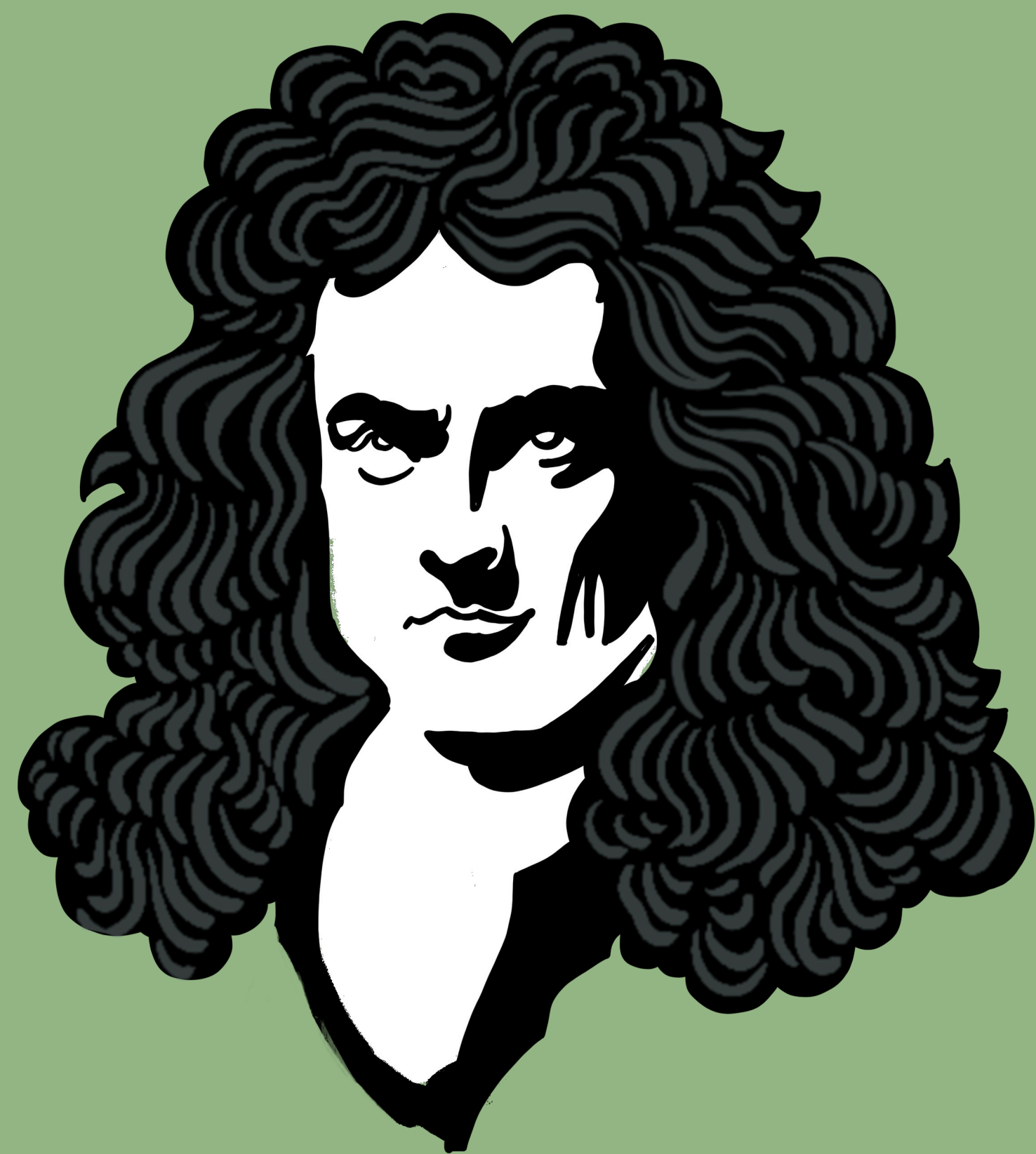
Isaac Newton 1642-1727

Den engelske fysikern och matematikern Isaac Newton undersökte färg med hjälp av ett prisma och konstaterade att färg endast är en egenskap hos ljuset, inte ett pigment.