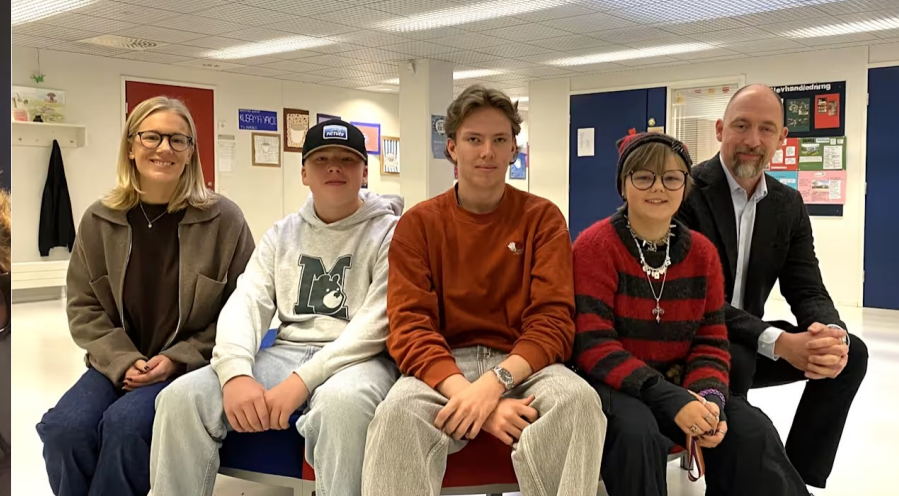
Elev i Vasaskola om mobilförbudet: "Helt bra"