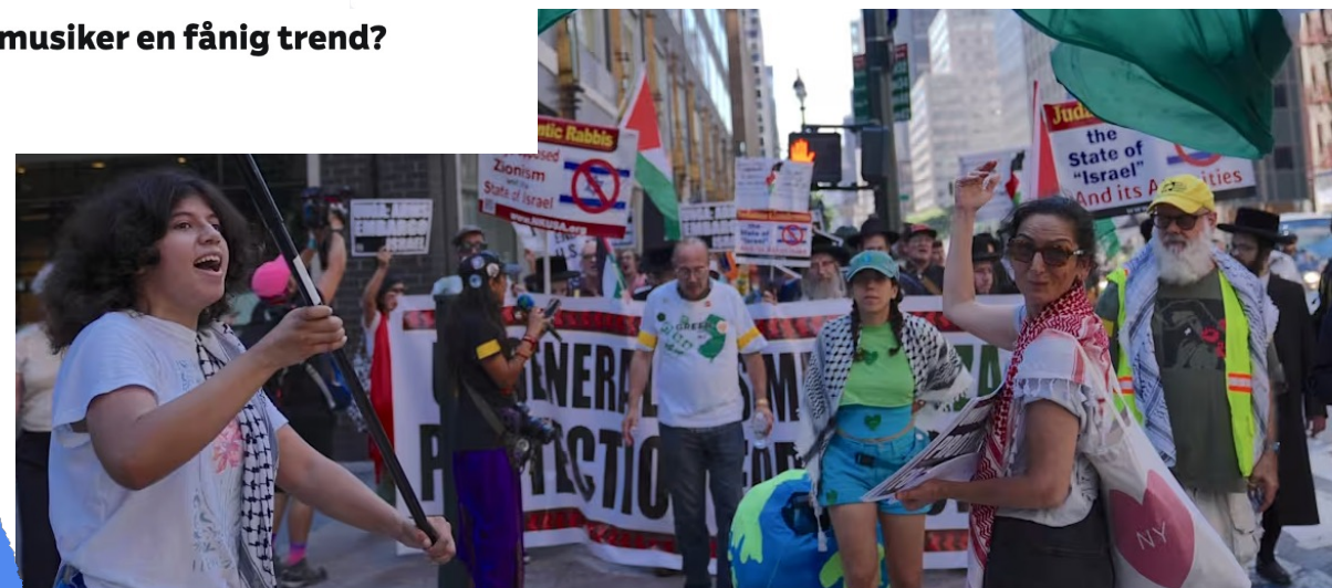
Ödesvecka för Palestina då världsledare möts i New York nya erkännanden av staten väntas